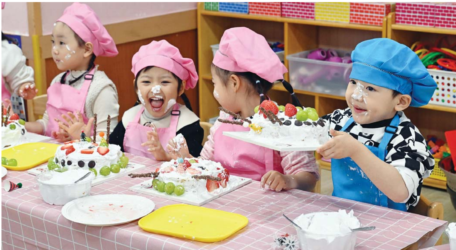
“성탄절 케이크 만들어요” 성탄절을 이틀 앞둔 23일 광주 북구청 직장어린이집에서 아이들이 요리활동 시간에 부모님께 드릴 자신만의 특색 있는 생크림 케이크를 만들며 즐거운 시간을 보내고 있다. /김애리 기자·조영권 인턴기자

광주시 소방안전본부는 23일 “성탄절과 연말 연시를 맞아 시민 안전 확보를 위한 특별경계근 무를 실시한다”고 밝혔다. 이번 특별경계근무는 성탄절 기간인 24~26일 과 연말연시인 31일부터 2026년 1월4일까지 진 행한다. 이 기간 소방공무원과 의용소방대원 등 2천918명, 소방장비 282대를 동원해 화재와 각종 안전사고에 대비한다. 소방안전본부는 ▲기관장 지휘선상 대기 ▲전 직원 비상대응 태세 유지 ▲화재취약지역 예 방순찰 강화 ▲다중이용시설 관계자 자율안전 관리 지도 ▲소방용수 및 시설장비 100% 가동 유지 등을 중점 추진한다. 특히 제야 타종식이 열리는 5·18민주광장에 는 소방차를 전진 배치해 인파 밀집에 따른 사 고를 예방하고 사고 발생 시 현장 응급처치, 병 원 이송 등 신속한 대응에 나설 계획이다. 또 한파·폭설 등 자연재난에 대비해 119상황 관리 기능을 강화하고 의료기관, 약국 정보, 119 응급의료 안내 등 생활민원 서비스를 적극 지원 한다. /변은진 기자