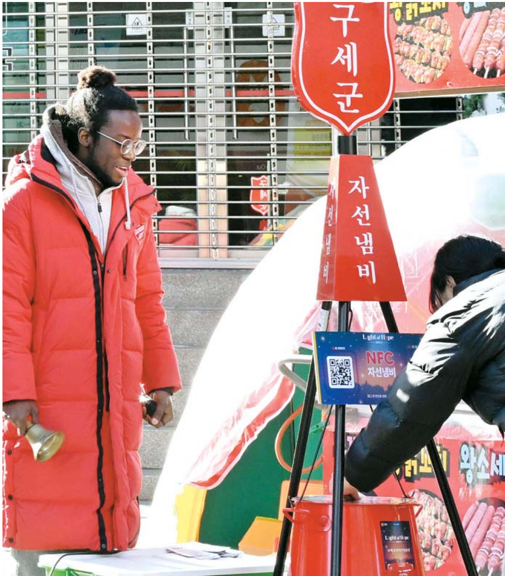
연말 한파 녹이는 사랑의 종소리 올해도 세밀 한파를 녹이는 구세군 사랑의 종소리가 울려 퍼진 가운데 21일 광주 동구 충장로에 등장한 구세군 자선냄비에 시민들이 성금을 넣으며 온정을 나누고 있다.