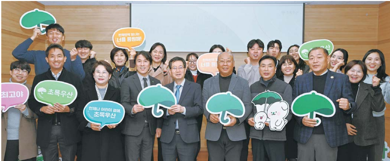
15일 오후 광주 서구 초록우산 광주지역본부에서 '광주 온(ON)돌봄' 시범사업 성과공유회가 열려 참석자들이 기념촬영을 하고 있다.

이들엔겐 1인당 최대 100만원의 현금이 지급됐다. 또 각 수혜자별로 통합 돌봄 코디네이터를 통해 반찬 전달, 가사 도우미 확대 운영 등 총 5천500만원 상당의 맞춤형 서비스가 지난달까