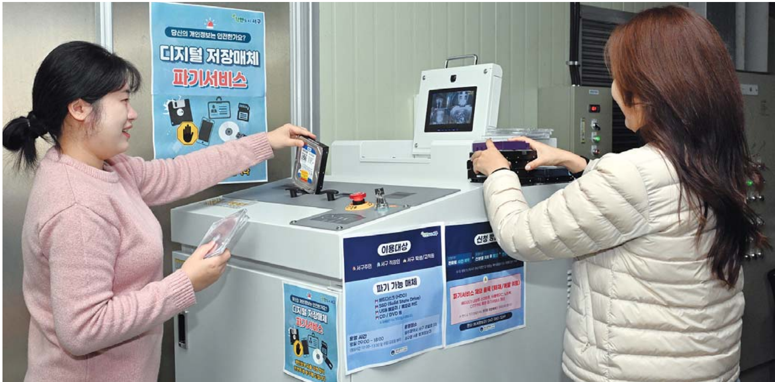
광주 서구 ‘디지털 저장매체 파기 서비스’

광주 서구가 11일 오전 청사에서 개인정보 유출 없이 디지털 저장매체를 파기하는 서비스를 시작해 시민들이 개인정보가 담긴 하드 디스크를 전용 파쇄기에 넣고 있다.