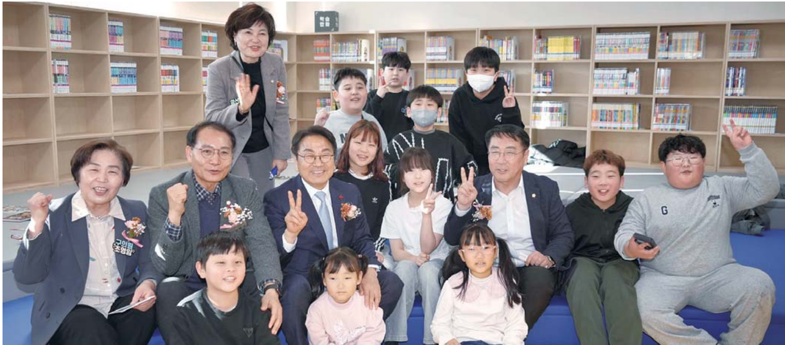
강기정 광주시장이 9일 광산구 첫 시립도서관인 하남도서관 개관식에 참석해 참석자들과 함께 기념촬영을 하고 있다.