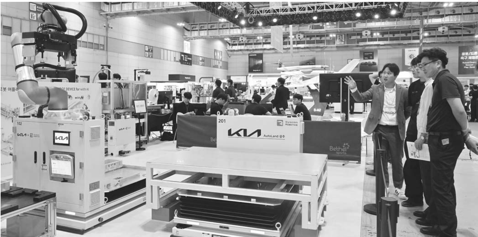
호남권 최대 산업전시회인 '2025 광주미래산업엑스포'가 25일 오후 광주 서구 김대중컨벤션센터에서 개막해 관람객들이 시스템로봇틱스 자율주행로봇을 보고 있다. 오는 28일까지 열리는 이번 전시회는 국내·외 270여개 기업이 570개 부스를 운영하며 미래 산업의 최신 기술과 제품을 전시한다. /김애리 기자

특히 그는 “무한 입증을 요구받는 부분엔 무한 입증을 하겠으나 적어도 소명된 부분에 대해선 인정이 필요하다”고 덧붙였다. /김진수 기자