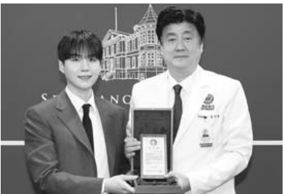
그림 방탄소년단(BTS)의 슈가(좌)와 금기창 연세의료원장(우)

그림 방탄소년단(BTS)의 슈가(본명 민윤기)가 세브란스병원에 50억원을 기부해 자폐스펙트럼장애 소아청소년의 치료와 사회적 자립을 돕는 ‘민윤기 치료센터’를 건립한다. 세브란스병원은 지난 23일 병원 제2층 1층에서 민윤기 치료센터 착공식을 열었다고 밝혔다. 오는 9월 완공 예정인 민윤기 치료센터에서는 언어·심리·행동 치료 등 소아청소년의 정신 건강을 지원하고, 임상·연구를 연계한 다양한 프로그램을 운영한다. 슈가는 “프로그램 준비와 봉사활동을 통해 음악이 마음을 표현하고 세상을