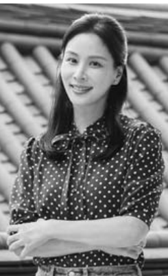
배우 고소영

로그램에 고정 멤버로 등장하는 것은 1992년 데뷔 이래 처음이다. 그는 정신건강의학과 전문의이자 방송인으로 활동하는 오은영 박사와의 개인적인 인연도 출연 계기로 꼽았다. 고소영은 “출연 결심을 하게 된 데는 오은영 선생님의 영향이 가장 컸다”며 “부모로서 걱정이 있었을 때 오은영 선생님을 만나 될 기회가 있었고, 개인적으로 친분이 있다”고 말했다. 이어 “15년 동안 결혼생활 하면서 엄마로서, 딸로서 나눌 수 있는 공감대가 있지 않을까 싶었다”며 “제가 어떤 조언을 해드리기보다는 더 위로받고, 큰