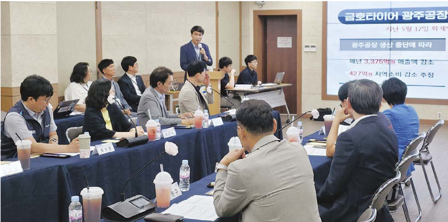
금호타이어 광주공장 화재 발생 한 달여 만인 23일 오후 광주 광산구청 상황실에서 열린 노사민정협의회에서 ‘고용위기지역 지정 신청’ 안건에 대한 심의가 이뤄지고 있다.

그러나 최근 광산구에는 ▲대우위니아 계열사 파산 ▲삼성전자 냉장고 생산라인 해외 이전 ▲금호타이어 대형화재 등 위기가 연쇄적으로 찾아왔다.