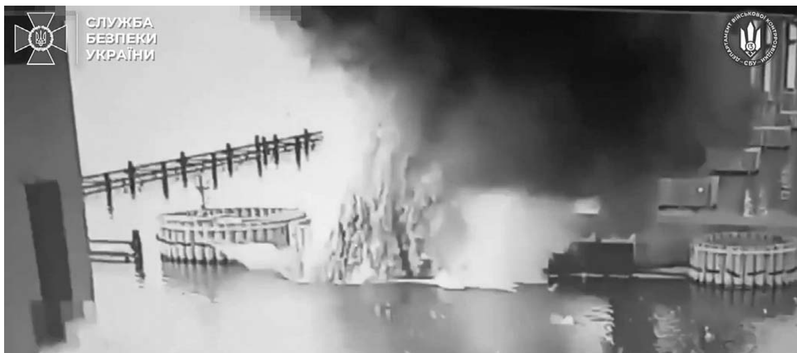
우크라, 크림대교 수중 교각 폭파 3일(현지시간) 우크라이나 보안국(SBU)은 러시아 본토와 크림반도를 잇는 크림대교(크리치해협대교)의 수중 교각에 폭발물을 매설해 폭파하는 특수 작전을 완수했다고 밝혔다. 사진은 이날 SBU가 공개한 폭발 순간. /EPA=연합뉴스

그러면서 그는 “중국에 대한 경제적 의존은 그들(중국)의 해로운 영향력을 심화시킬 뿐이며, 긴장된 시기에 우리의 국방 관련 결정의 공간을 복잡하게 만든다”고 주장했다. /연합뉴스