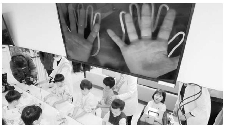
'손씻기'로 감염병 예방해요 13일 광주 북구보건소에서 열린 올바른 '손씻기' 교육에 참여한 어린이집 원생들이 감염병 예방팀 직원들로부터 손씻기 방법을 배우고 있다. /김애리 기자

앞서 전남도 약사회는 지난 2일부터 유가족을 위해 무안공항 내에 봉사약국을 마련, 순차 근무하고 있다. /기수희 기자