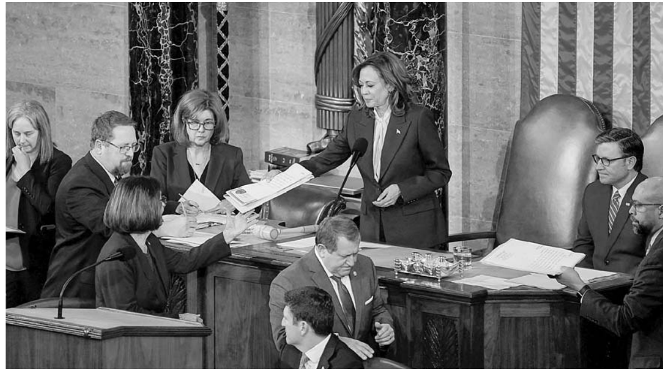
도널드 트럼프 당선인에게 선거에서 패배했던 카말라 해리스 부통령이 6일(현지시간) 상원의장 자격으로 미국 연방의회 상·하원 합동회의를 주재하고 있다.

이어 "오늘 미국의 민주주의는 견제"를 강조했다. 백악관이 전했다. 앞서 해리스 부통령은 대선 선거 운동 때 트럼프 당선인을 향해 대통령 재직시 헌법 수호 선서를 위반했다고 비판한 바 있다.