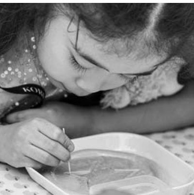
'달고나' (dalgona) 만들기 체험하는 외국 어린이.

'떡볶이'는 "고추장으로 만든 매콤한 소스로 요리한 작은 원통형 떡으로 구성된 한국 요리로, 보통 간식으로 제공