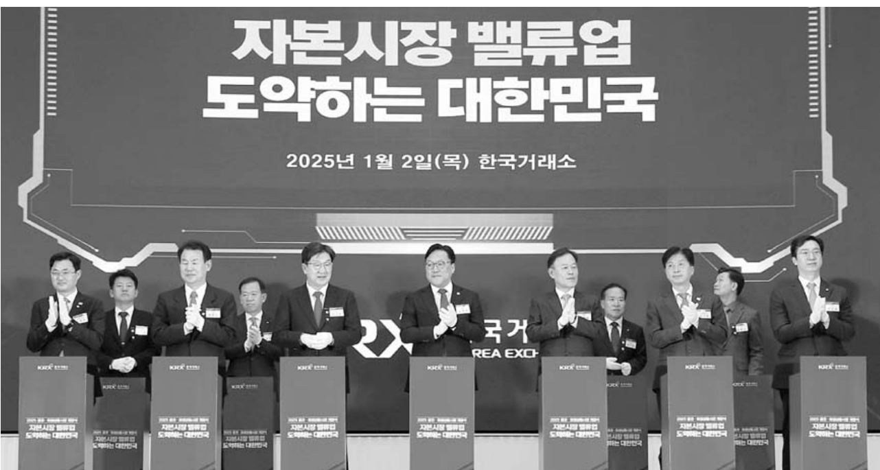
2025 증권·파생상품시장 개장식 2일 오전 서울 여의도 한국거래소(KRX) 홍보관에서 열린 2025 증권·파생상품시장 개장식에 참석한 관계자들이 개장신호를 누르는 퍼포먼스를 하고 있다.

세입자의 전세 보증금을 두 차례 이상 제때 돌려주지 않은 '악성 임대인' 명단이 공개 1년 만에 1천177명(법인 포함)으로 불어났다. 이들이 떼어먹은 전세금은 모두 1조9천억원에 이른다. 19세 '악성 임대인'도 있었으며, 20~30대가 32%를 차지했다. 2일 안심전세포털에 따르면 이날 기준으로 이름과 신상이 공개된 '상습 채무 불이행자'는 개인 1천128명, 법인 49개사다. 정부는 전세사기 예방을 위해 2023년 12월 27일부터 상습적으로 보증금 채무를 반환하지 않은 임대인의 이름, 나이, 주소, 임차보증금 반환 채무, 채무 불이행 기간 등을 공개하고 있다. 주택도시보증공사(HUG)가 세입자에게 전세금을 대신 돌려주고서 청구한 구상 채무가 최근 3년간 2건 이상이고, 액수가 2억원 이상인 임대인이 명단 공개 대상이다. 명단이 공개된 악성 임대인의 평균 연령은 47세이며, 1인당 평균 16억1천만원의 전세금을 돌려주지 않은 것으로 나타났다.