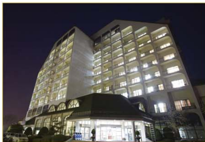
프리실버타운 탐라 도고

탐라레저그룹은 국내 최초로 프리실버타운 탐라 입주권을 1,500만원 특가로 1차 150구좌 한정 분양합니다.