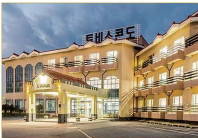
프리실버타운 탐라 제주