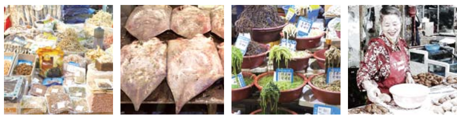
건강한 남도의 산지 직송 농수산물 | 원산지표시 전국 우수 전통시장 | 인정명치는 시장

*양동시장은 특히 제수용품이나 온수용품으로 유명하며 4월-9월에는 첫째-셋째 주 일요일이 정기휴일이고, 10-3월에는 휴일이 없습니다.