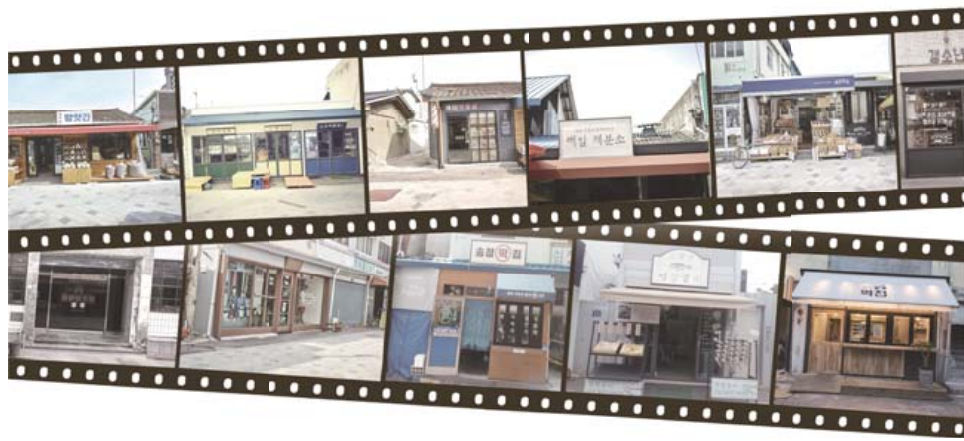
정기휴무 - 매월 둘째주 월요일, 자율 휴무 - 매월 넷째주 월요일

전통과 현재의 만남 시간이 멈춘 그곳에서의 초대, 1913송정역시장으로 놀러오세요!