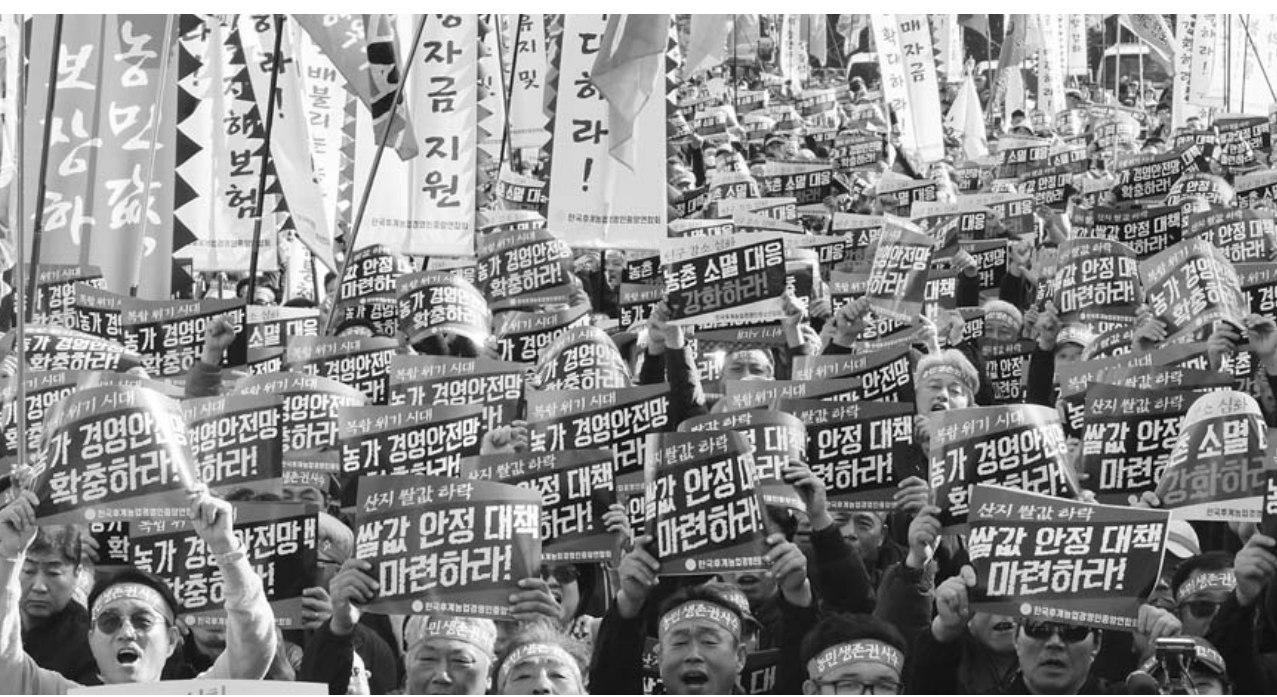
쌀값 안정대책 마련하라! 한국농협중앙회농정혁신촉구농민총궐기대회를 열고 구호를 외치며 쌀값안정대책 마련을 촉구하고 있다.