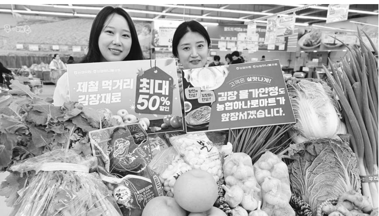
‘할인에 진심! 김장비는 안심!’ 농협유통이 김장 물가 안정을 위해 오는 7일부터 다음 달 4일까지 ‘할인에 진심! 김장비는 안심!’ 행사를 진행한다. 사진은 하나로마트에서 김장 물가안정 행사를 소개하는 모습.