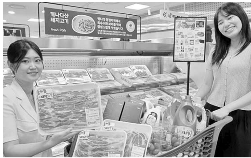
롯데마트 '스노우플랜 가을 페스타'에서는 캐나다산 삼겹살과 목심을 저렴한 가격에 선보인다.

우 (100g)는 50% 할인해 각 2천500원, 2천900원에 선보인다. '헛 호박고구마 (여주·해남·영암, 1kg)'와 '호주정정 우 안심 (100g)'도 할인한다. 추석 연휴 동안 기름진 명절 음식에 지친 입맛을 깨워줄 음식들로 구성된 '회근 얼얼 페스타'에서는 델리부터 간편식까지 다양한 먹거리를 준비했다. 멤버십 회원 대상으로 '보며먹 한입 고추장 삼겹살 (600g)'과 '강원도 돼지 고추장 불고기 (800g)', '용두동 낙지/주꾸미 볶음 (608g·600g)'을 각 40% 저렴하게 구매 가능하다.