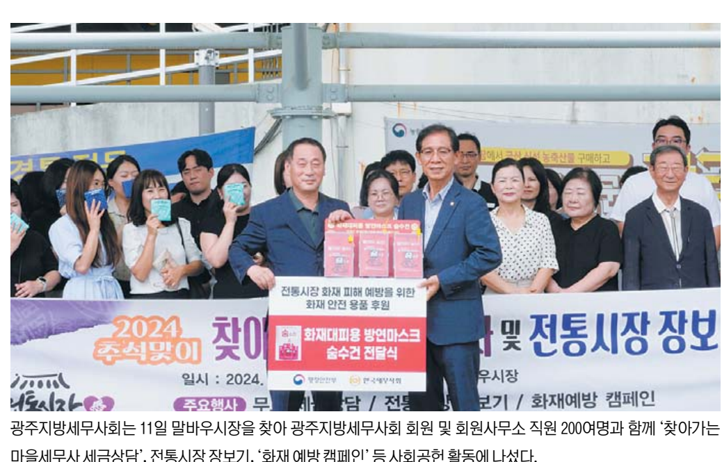
광주지방세무사회는 11일 말바우시장을 찾아 광주지방세무사회 회원 및 회원사무소 직원 200여명과 함께 '찾아가는 마을세무사 세금상담', '전통시장 장보기', '화재 예방 캠페인' 등 사회공헌 활동에 나섰다.