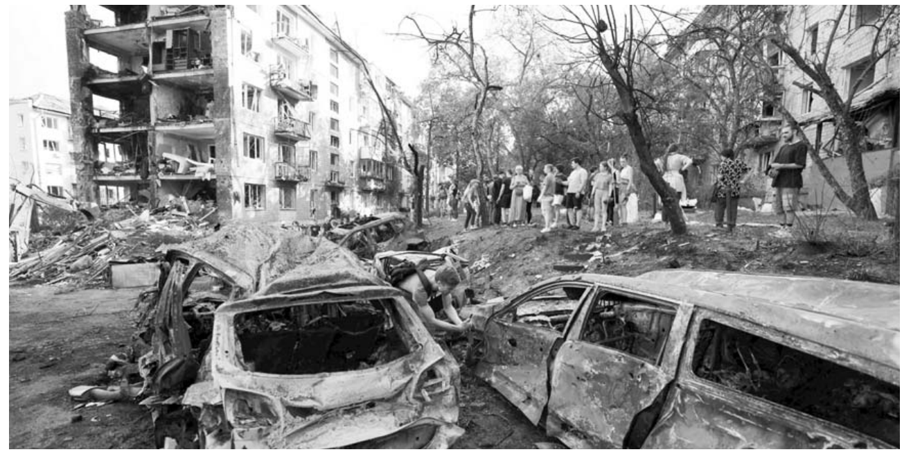
지난 8일(현지시간) 우크라이나 키이우 주민들이 러시아의 미사일 공격으로 파괴된 건물과 차량을 바라보고 있다.

책임져야 한다"면서 유엔 안전보장이사회를 열어달라고 요청했다. 러시아는 에너지 시설 파괴 시도에 대응해 우크라이나 군사시설과 공공기지를 공습했다면서도 어린이병원 등 민간시설을 겨냥했다는 우크라이나 주장은 사실과 다르다고 반박했다. 러시아 국방부는 우크라이나 방공망에서 발사된 미사일이 키이우에 떨어진 사실을 영상으로 확인했다며 이같이 주장했다. /연합뉴스