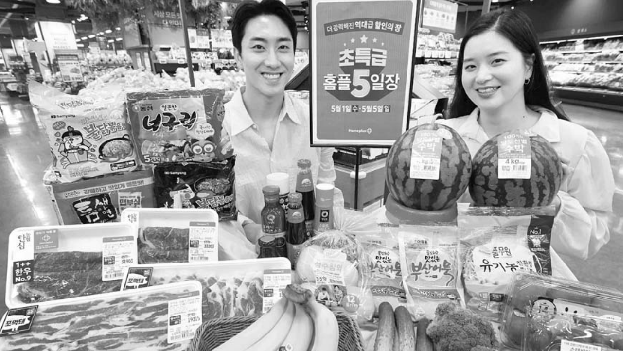
홈플러스가 가정의 달 5월을 맞아 ‘초특급 5일장’ 행사를 열어 온 가족이 함께 즐길 수 있는 먹거리를 최적인 가격에 제공하는 등 다양한 할인 이벤트를 진행한다.

며 당일생산·판매를 원칙으로 소진되지 않은 빵은 지역 복지센터에 후원하는 등 나눔활동을 꾸준히 펼치고 있다. 베비에르는 지역민의 사랑에 보답하고자 동행축제에 참여해 오는 8일까지 11개 전 지점에서 모든 제품에 대해 10% 할인행사를 진행하고 동행축제 홍보에도 동참해 지역경제 활성화에 힘을 보탬 예정이다. 조종래 광주·전남중소벤처기업청장은 “얼어붙은 소비심리로 어려움이 많은 지역 중소기업·소상공인의 얼굴에 웃음꽃이 필 수 있도록 동행축제 기간에 향토기업 제품을 많이 구매해 주시길 부탁드립니다”고 말했다.