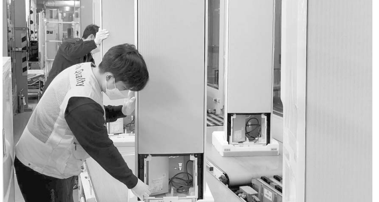
무풍에어컨 생산라인 풀가동 삼성전자가 여름을 앞두고 무풍에어컨 생산라인을 풀가동해 국내 에어컨 시장 공략을 강화한다고 25일 밝혔다. 사진은 광주구 하남산단 내 삼성전자 광주사업장에서 직원들이 '비스포크 무풍에어컨 갤러리'를 생산하는 모습.