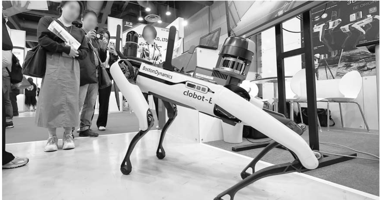
자율레이저 스캐닝 모듈 장착한 로봇 24일 오전 서울 강남구 코엑스에서 열린 '한국전자제조산업전 x 오토모티브월드코리아'를 찾은 관람객들이 자율레이저 스캐닝 모듈을 장착한 로봇의 시연을 지켜보고 있다.

한국무역협회 광주전남지역본부는 24일 "중소기업의 글로벌 시장 진출 기회 확대를 위해 광주 홀리데이인 컨벤션홀에서 '전문무역상사 초청 광주·전남 수출상담회'를 개최했다"고 밝혔다. 행사에는 전문무역상사-해외비이어 15개사와 광주·전남 우수 제조 기업 56개사 관계자가 참석해 총 113건의 수출 상담이 이뤄졌다. 수출 상담은 화학제품·기계 등 산업 재부터 농식품·화장품·의료기기 등 소비재까지 다양한 산업 분야를 아울렀으며 참가 기업들은 전문 무역상사와 1:1매칭 상담을 통해 제품의 신규 시장 진출 기회를 얻을 수 있었다. 또 월마트 출자 재단인 스타트업 정기(Startup Junkie)가 참여해 광주·전남 기업들에 새로운 비즈니스 기회를 제공했다. 스타트업 정기는 월마트 창업자인 샘 윌튼 일가가 출연·후원하는 재단으로 월마트, 페덱스, 타이슨 푸드 등을 주요 협력 파트너로 두고 있다. 중소기업들은 스타트업 정기와의 상담을 통해 자사 제품의 미국 시장 진출 가능성을 타진해보고 시장 진출 전략에 관한 전략적 조언을 얻을 수 있었다. 이동원 한국무역협회 광주전남지역본부장은 "이번 수출 상담회를 통해 지역 기업들이 글로벌 시장에 한 걸음 더 나아갈 수 있는 계기가 되길 바란다"며 "앞으로도 지역 기업들의 수출 지원을 위해 다양한 프로그램을 지속적으로 마련할 계획"이라고 말했다. /김현지기자