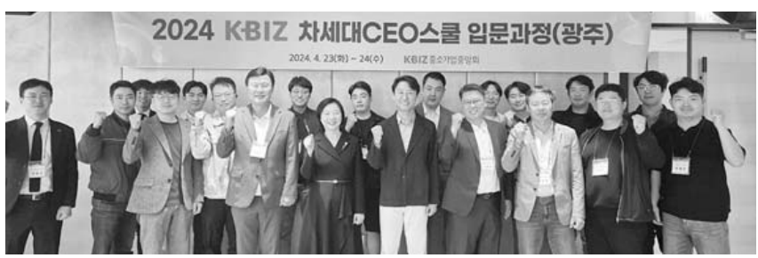
30여명이 참석한 이번 교육에서는 ▲상속 증여세 기초과정 ▲기업승계 전략 ▲중대재해처벌법 대응방안을 비롯해 현장 경영애로에 대한 간담도 이뤄졌다.

중기중앙회 광주전남본부는 23~24일 여수 소노캄호텔에서 '광주전남 차세대경영자협의회 간담 및 임문교육'을 개최했다. (사진) 지역 중소기업계 차세대 CEO 50여명으로 구성된 광주전남 차세대경영자협의회는 지난해 11월 창립 총회를 갖고 본격적인 활동을 시작했으며 이번 임문 교육을 통해 중소기업의 원활한 기업승계에 대한 기초 지식을 쌓고 회원 간 상호 교류의 시간을 가졌다.