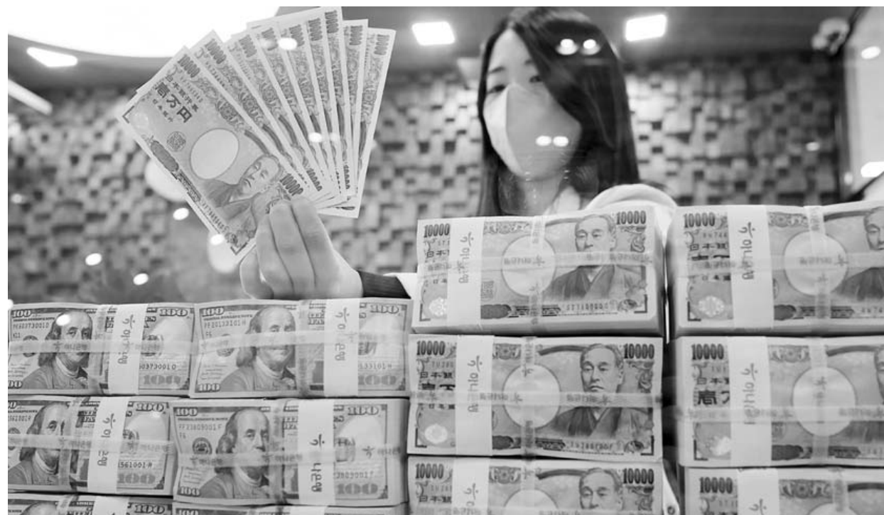
엔화 가치 34년 만에 최저 23일 서울 중구 하나은행 위변조대응센터에서 직원이 엔화와 달러화를 정리하고 있다. 이날 엔/달러 환율이 달러당 155엔대에 육박하며 엔화 가치가 34년 만에 최저로 떨어졌다. /연합뉴스

이늘면서 국내 공급이 줄어서 가격이 오른 것 같다"고 설명했다. /연합뉴스 인스타, 1분기 '자주사용한 앱' 2위 인스타그램이 1분기에 네이버와 유튜브를 제치고 '한국인이 자주 사용한 앱' 2위를 기록했다는 조사 결과가 나왔다. 23일 앱·리테일 분석 서비스 와이즈랩·리테일·굿즈(이하 와이즈랩)가 국내 스마트폰 사용자 표본 조사한 결과 인스타그램의 1분기 월평균 실행 횟수는 약 149억3천374만회로 카카오톡(727억108만회)에 이어 2위를 기록했다. 인스타그램의 실행 횟수는 지난해 1분기 109억8천954만회로 카카오톡, 네이버, 유튜브에 이어 4위였지만 지난해 4분기 137억373만회로 급증하며 유튜브(136억4천151만회)를 제치고 3위로 올라선 뒤 1분기에 네이버까지 뛰어넘어 2위로 등극했다. /연합뉴스