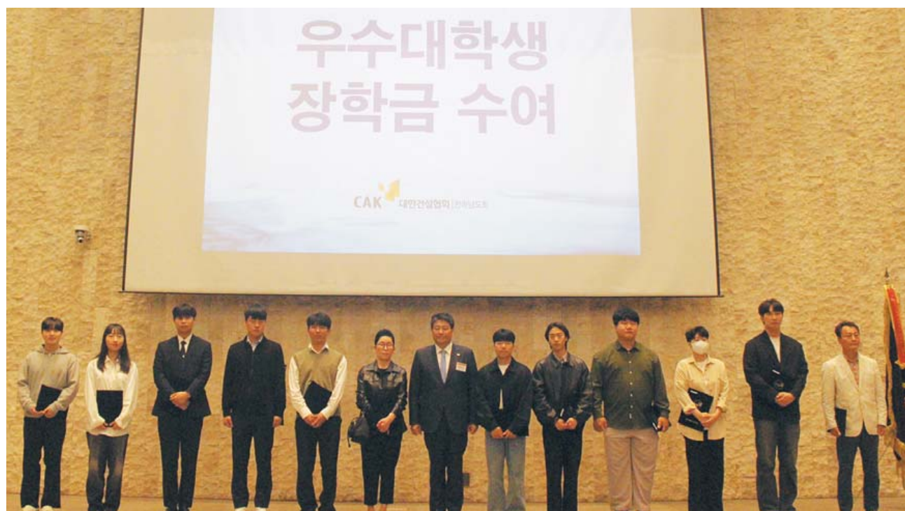
대한건설협회 전남도회는 23일 웨딩그룹위더스 광주 5층 그랜드볼룸에서 제66회 정기총회를 개최한 가운데 2023회계연도 주요업무 추진실적을 보고하고 2023회계연도 수입지출 결산(안)승인의 건, 2024회계연도 사업계획(안) 및 수입지출 예산(안)결정의 건을 의결했다. 사진은 장학증서 및 장학금을 수여받은 광주·전남지역 우수 대학생들이 기념촬영을 하고 있는 모습.