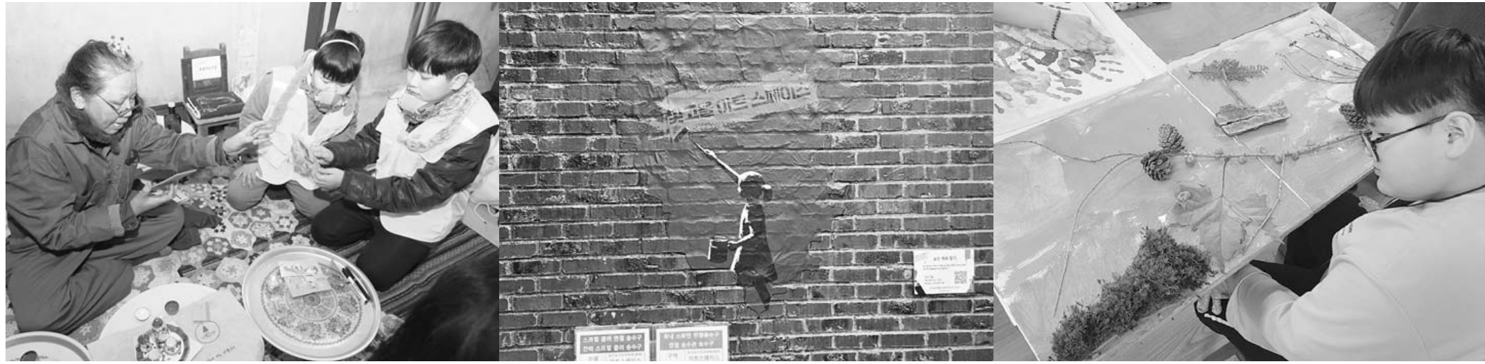
광주문화재단이 지난 2년 간의 창의예술교육 사업 성과를 발표했다. 사진은 (왼쪽부터) '시민행동을 예술프로젝트로' 기후행동놀이 모습, '김정 광주두들쟁이들이' 제작한 빛고을아트스페이스 건물 벽화 포토존, '시민결음 탐구생활' 걷기 표현 예술치료 활동.