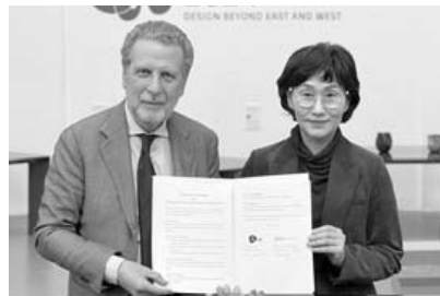
ADI(이탈리아산업디자인협회) 뮤지엄과 협약을 체결했다. <사진> 세계적인 디자인계 거장 스테파노 지오반노니도 2025광주디자인비엔날레 참여 의향을 밝혔다.

-서양을 넘나드는 디자인'을 주제로 한 이번 전시는 한국-이탈리아 수교 140주년을 기념해 광주디자인진흥원, ADI뮤지엄, 국민대 산학협력단이 공동으로 마련했다. 지난해 제10회 광주디자인비엔날레 출판작 '아세안웨이'를 비롯해 우철을 소재로 한 한국과 이탈리아 디자이너 작품들이 전시되고 있다. 해외 홍보 전시와 함께 선진 디자인 기관과의 교류협력도 강화한다. 진흥원은 지난 17일 오후 이탈리아 밀라노