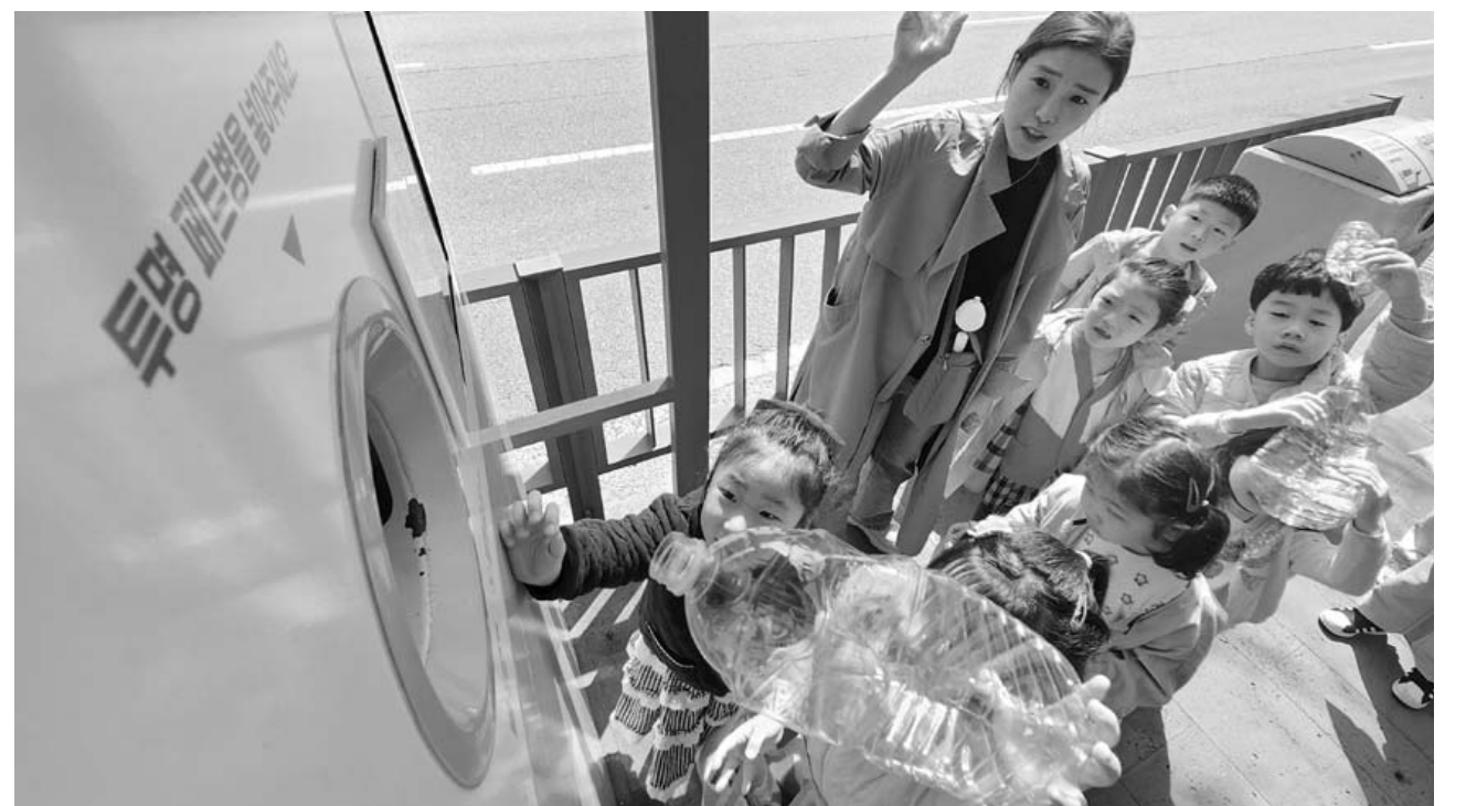
재활용으로 환경지켜요 9일 오전 광주 북구청직장어린이집 원생들이 고품질 재활용 체계를 구축하고 분리배출 문화 확산 등 기후환경극복을 위해 전담대 후문에 설치된 무인회수기에 그동안 모아온 투명페트병을 넣고 있다. /김애리기자

국내 금융지주회사들이 지난해 거둔 순이익이 3년 연속 20조원을 넘긴 것으로 집계됐다. 금융투자과 여신전문금융(카드·캐피탈·저축은행) 계열사 실적은 악화했지만, 은행과 보험 계열사의 이익이 균건히 늘어난 덕분이다. 9일 금융감독원이 발표한 2023년 금융지주회사 경영실적(연결기준) 잠정치에 따르면 국내 10개 금융지주사(KB·신한·농협·하나·우리·BNK·DGB·JB·한국투자·메리츠)가 지난해 거둔 당기순이익은 21조5천240억원으로 지난해(21조4천470억원) 대비 776억원(0.4%) 증가했다. 이로써 금융지주회사의 당기순이익은 2021년 21조1천800억원에 이어 3년 연속 20조원을 넘어섰다. 자회사 권역별 순이익(개별당기순이익 기준)을 살펴보면 은행이 15조4천억원, 보험이 3조3천억원, 금융투자회