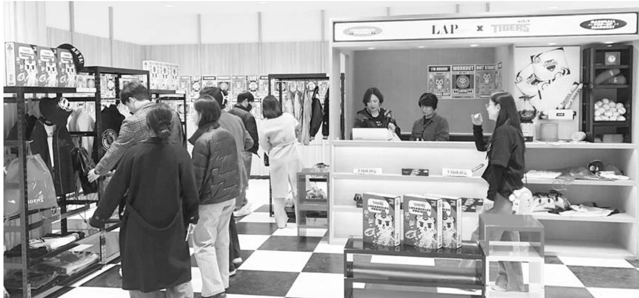
광주신세계 본관 1층 이벤트 홀 팝업 스토어에서 고객들이 영캐주얼 브랜드 랩과 기아 타이거즈 야구단의 콜라보 제품을 살펴보고 있다.

광주신세계가 영캐주얼 브랜드 ‘랩(LAP: LOS ANGELES PROJECT)’과 기아 타이거즈 야구단의 콜라보를 기념해 오는 31일까지 본관 1층 이벤트 홀에서 첫 오프라인 팝업을 열고 다양한 이벤트를 진행한다. 지난 14일 랩 공식 자사몰 데이터와 SSG닷컴을 통해 구단을 상징하는 기아 타이거즈 로고를 모티브로 티셔츠, 원피스, 모자, 가방 등 다양한 아이템을 선보였다. 이번 제품은 정형화된 야구 유니폼이 아닌 일상에서 착용 가능한 아이템으로 야구 팬들을 비롯해 일반 고객들도 관심을 가질 것으로 보인다. 이벤트 홀에서는 구매 고객을 대상으로 매장서 사용 가능한 20% 할인 쿠폰과 양말을 증정하고 특가 이벤트와 경품 추첨 등 다양한 프로모션을 진행한다. 구매 고객을 대상으로 증정하는 응