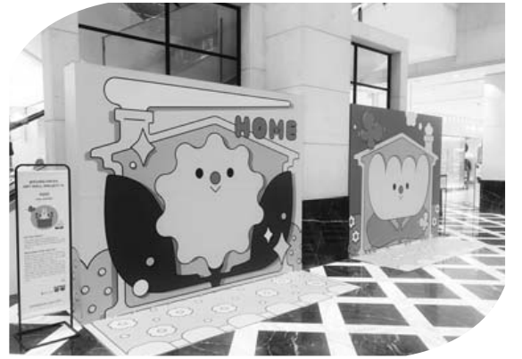
신세계 1층 ‘아트월 포토존’

뷰티살롱 체험은 롯데백화점 앱(APP)을 통해 예약 후 당일 매장에서 일정 금액 이상 구매 시 체험할 수 있다. 11층 갤러리에서는 오는 24일까지 박현진의 ‘Romance’전이 열린다. 광주에 처음 선보이는 이번 전시는 사진을 통해 포착된 풍경과 사물을 감각적인 색채로 재구성해 예술을 통해 삶의 어려움을 견디길 바라는 작가의