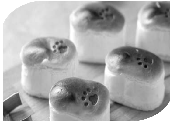
롯데백화점 ‘토라네코 치즈케이크’

크는 10개 2만3천원, 녹차말차 피스타치오 다크초코 치즈케이크는 모두 2만4천원에 맛볼 수 있다. 오는 31일까지 진행되는 뷰티컨설팅 서비스 ‘뷰티 살롱’에서는 전문 아티스트가 헤어·메이크업 등을 진행하고 맞춤형 아이템을 추천해준다. 고급 헤어팩, 샴푸 제품 등으로 인기가 높은 시슬리와 아베다에서는 두피 민감도와 모발의 밀도, 굵기 등을 5단계로 진단해 주는 하이테크 디바이스 등을 통해 헤어케어 제품을 컨설팅해 주고 맥, 바비브라운, 베네피트, 나스 등 색조 화장품으로 유명한 메이크업샵에서는 전문 아티스트가 개성에 맞는 피부표현과 메이크업 룩을 연출해 준다.