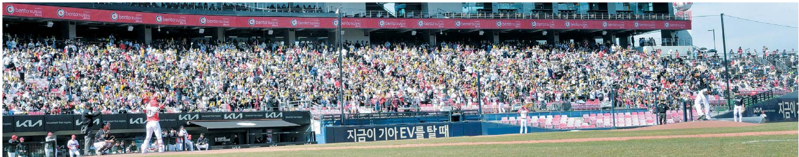
‘반갑다, 프로야구!’ 불기운이 완연한 지난 16일 오후 광주기아챔피언스필드에서 열린 2024 한국프로야구 KIA 타이거즈와 KT 위즈 시범경기를 찾은 관중들이 열띤 응원을 펼치고 있다. >관련기사 16면