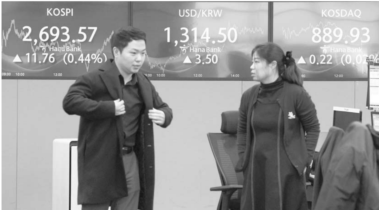
코스피·코스닥 동반 상승 13일 오후 서울 중구 하나은행 딜링룸 현황판에 코스피·코스닥 지수가 표시되어 있다. 이날 코스피는 전장보다 11.76포인트(0.44%) 오른 2,693.57, 코스닥지수는 전 거래일보다 0.22포인트(0.02%) 오른 889.93에 장을 마쳤다. /연합뉴스

정부가 신속한 조치를 약속했다. 우선 기재부는 소상공인 부담 완화를 위해 지난달 29일 부가가치세법 시행령 개정을 완료해 오는 7월부터 간이과세자 기준이 연 매출 8천만원에서 1억400만원으로 상향 조정된다. 중소기업부는 지난달 21일부터 연 매출 3천만원 이하 영세 소상공인을 대상으로 최대 20만원의 전기요금 특별지원을 위한 접수를 시작했고 이르면 오는 20일부터 차감된 요금 고지서가 발급될 예정이다. 전날까지는 33만7천882명이 신청했다. 한편에 계약자 정보가 없는 비계약 사용자는 지난 4일부터 신청을 받아 서류 심사 후 전기요금 환급 조치가 진행된다. /연합뉴스