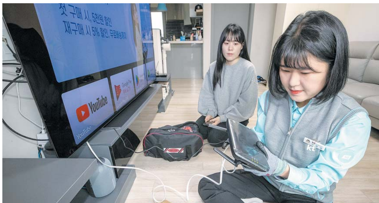
“여성 고객 안심케어” 시범 적용 KT가 세계 여성의 날을 맞아 여성 고객 안심케어 서비스를 광주를 비롯해 서울 서대문구, 경기도 성남시 등에 시범 도입한다고 6일 밝혔다. 사진은 안심케어 서비스 무선 품질 점검 모습.