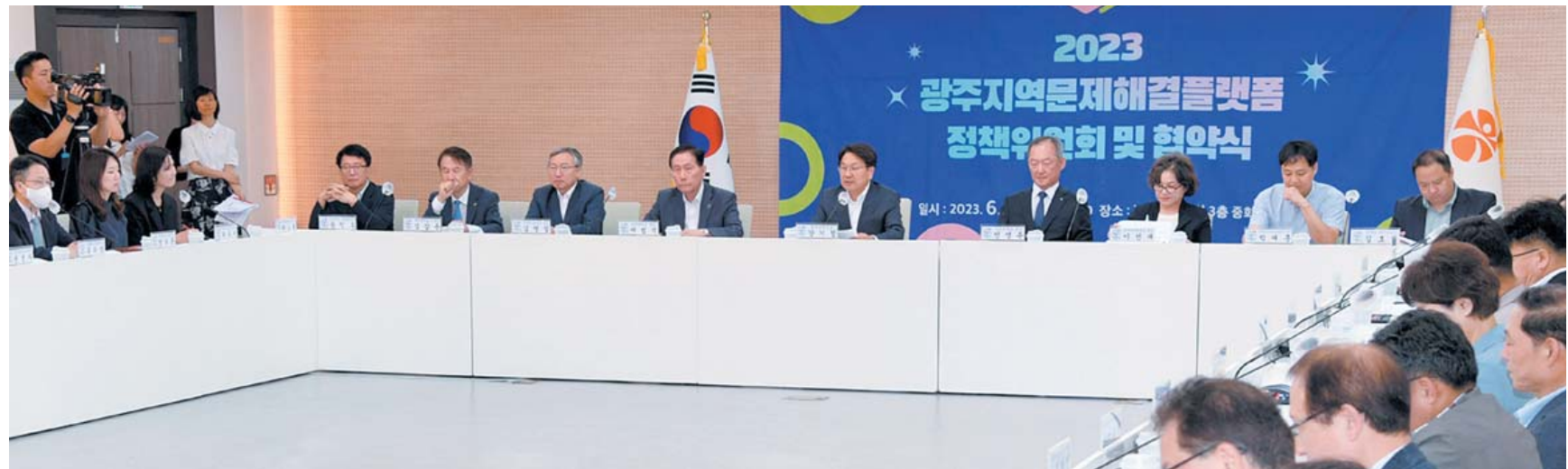
27일 오전 시청 중회의실에서 열린 2023년 지역문제해결플랫폼 정책위원회에 참석한 강기정 광주시장이 인사말을 하고 있다.

CJ푸드빌은 빍스, 더플레이스, 제일제면소, 한류, 푸레쥬 등 국내 최대 외식 프랜차이즈 브랜드를 운영하는 세계적 외식문화 기업이다. /김재정 기자