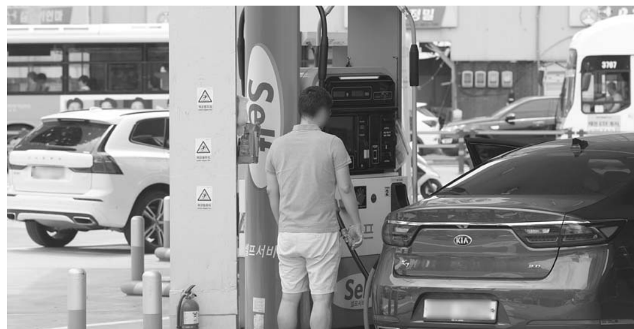
휘발유·경유 가격 동반 하락 한국석유공사 유가정보시스템 오피넷에 따르면 6월 첫째 주(4-8일) 전국 주유소 휘발유 평균 판매가격은 전주보다 10.1원 내린 1(리터)당 1천588.9원으로 집계됐다. 휘발유 가격은 주간 단위로 6주 연속 하락했다. 경유 판매가격은 전주보다 15.2원 내린 1천406.1원을 기록했다. 주간 단위로는 7주 연속 내렸다.

혁신 역량 강화와 성장을 집중적으로 지원해 왔다. 특히 자율형MC는 기업 간 상생협력 기반으로 다양한 사업화 연계기술 개발(R&BD)을 통한 공동 비즈니스 모델을 창출하는 산학연협의체로서 산단공 광주지역본부에서 광주 5개, 제주 1개 등 총 6개를 운영하고 있다. 이번 워크숍은 4차 산업혁명 시대 산업계에 부는 친환경 ESG경영, 디지털혁신 등 기업 생존을 위한 공유·협업·상생에 방점을 두고 창조적인 산학연 협력모델을 만들어가기 위해 마련됐다. 특강을 통해 제조기업의 ESG 대응과 실천과제를 포함한 디지털 트랜스포메이션 등 새로운 방식, 새로운 패러다임, 새로운 사업을 위한 리부트 활동의 중요성을 공유했다. 이와 함께 지난 19년간 만들어진 지역산업과 대학, 연구소 간 협력체계를 한층 고도화해 광주·제주지역 주력산업의 이슈 및 동향을 공유함으로써 동반성장의 기반을 더욱 공고히 했다. /양시원 기자