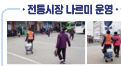
· 전통시장 나르미 운영 ·