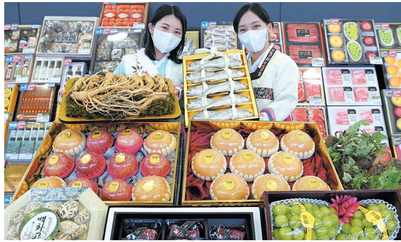
설 선물세트 사진예약 농협유통이 내년 1월6일까지 설 선물세트 사진예약 할인 행사를 진행한다고 27일 밝혔다. 사진은 농협하나로마트에서 2023년 설 선물세트 사진예약 행사를 소개하는 모습.

물가수준전망CSI(144)는 전월 대비 4p 하락했고, 주택가격전망CSI(63)는 전월 대비 2p 상승, 임금수준전망CSI(109)는 전월과 동일한 것으로 나타났다. /기수회기자