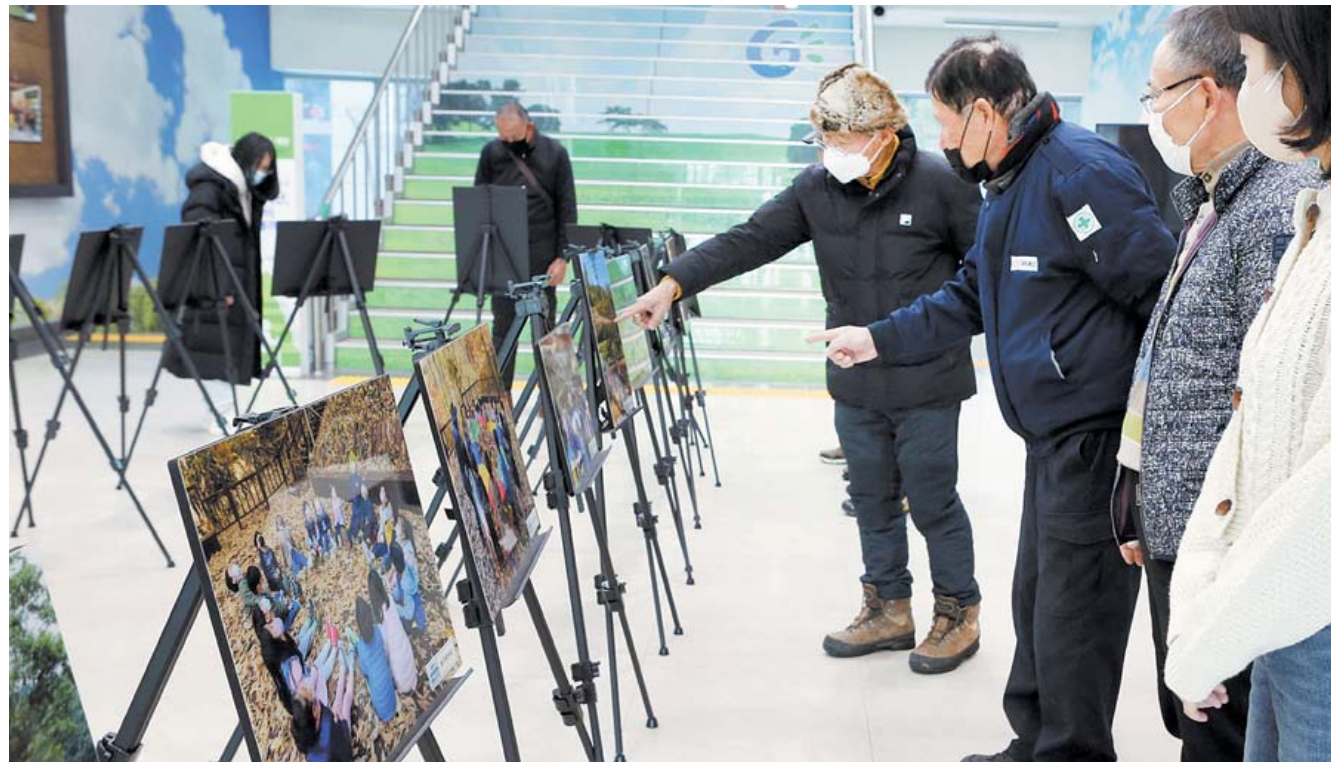
'데굴데굴 너릿재 유아수' 체험 사진전 광주 동구가 오는 23일까지 청사 1층 로비에서 어린이집 원생들의 체험활동을 기록한 너릿재 유아수 체험 사진전을 개최한다. 다양한 동·식물이 분포된 동구 선교동 너릿재 자락에 지난 9월 1일 개원한 영·유아 놀이 공간인 '데굴데굴 너릿재 유아수 체험원'은 자연학습·놀이공간 등 휴게공간으로 조성했다.

2019년 4월 출범한 '우리동네 복지기동대'는 전남 22개 시·군과 297개 읍·면·동에 모두 설치돼 기동대원 4천495명이 활동 중이다. 지금까지 취약계층 7만2천여가구에 115억원을 지원했다. 유현호 전남도 보건복지국장은 "겨울철 대비 취약계층 보호를 위한 복지기동대의 활동이 어려운 이들에게 큰 힘이 될 것"이라며 "특히 보일러 고장 등 열악한 주거환경으로 추위에 떨고 있는 분들을 위해 집 수리 등을 신속히 추진하겠다"고 말했다.