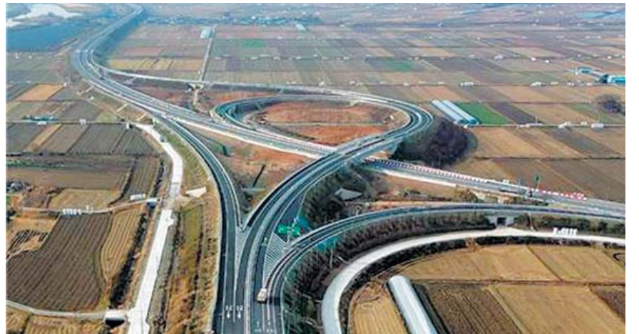
한국도로공사가 고속국도 제500호 광주외곽순환선 구간 중남광산 나들목에서 남장성 분기점까지 9.7km 구간을 개통했다. 사진은 남광산 나들목.

화순-나주를 연결하는 광주 외곽 제3순환도로가 완성된다. 앞서 제1구간인 금천-분남 15.5km 구간은 2013년 2월, 3구간인 장성-담양 구간은 2008년 1월 건설이 완료됐다. 국토교통부는 지난 2월4일 제2차 고속도로 건설계획(2021-2025년)에 화순-나주 구간 18.6km를 신규 반영했다. 사업비 1조5000억원이 투입된다. 광주시는 담양-화순 30.8km 구간에 대해 제3차 고속도로 건설계획(2026-2030년)에 반영될 수 있도록 국토부와 한국도로공사 등에 지속 건의할 방침이다.