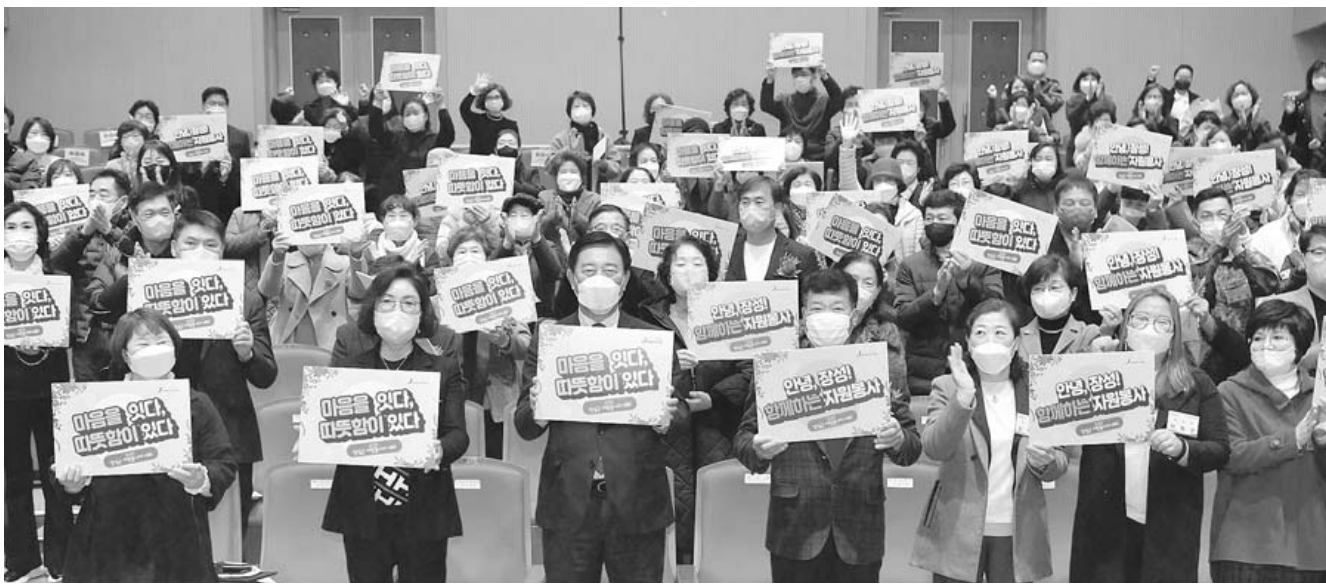
장성군, 자원봉사자 대회 장성군은 최근 장성문화예술회관 소공연장에서 '2022년 장성군 자원봉사자 대회'를 개최했다. 장성군 여성자원봉사회 주관으로 마련된 올해 행사는 식전 공연과 활동영상 시청, 우수 자원봉사자 표창 순으로 진행됐다.

로 첫날 행사를 마감한 포럼은 이틀째 섬 투어 퍼플섬 등으로 막을 내렸다. /신안=양훈기자