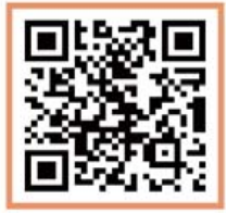
물절약 홍보 동영상