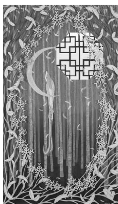
김진화작 '1월 밤'