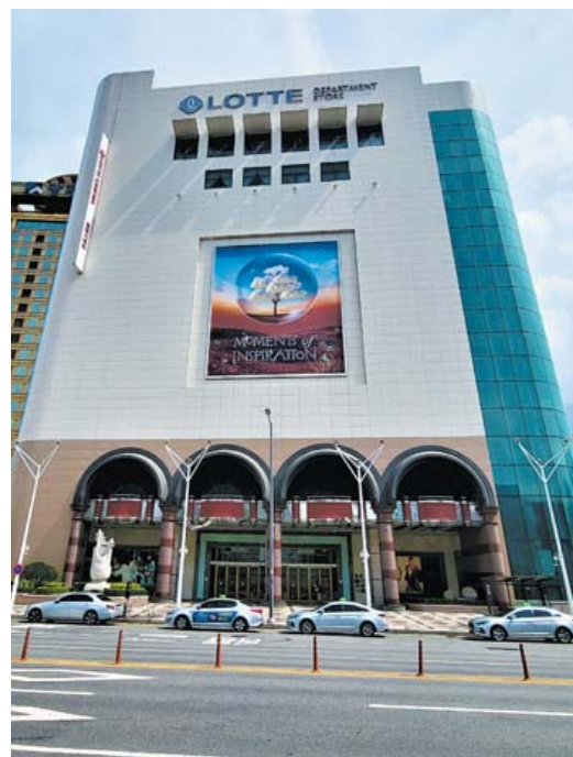
대인동 롯데백화점 광주점(향토지리연구소2022).