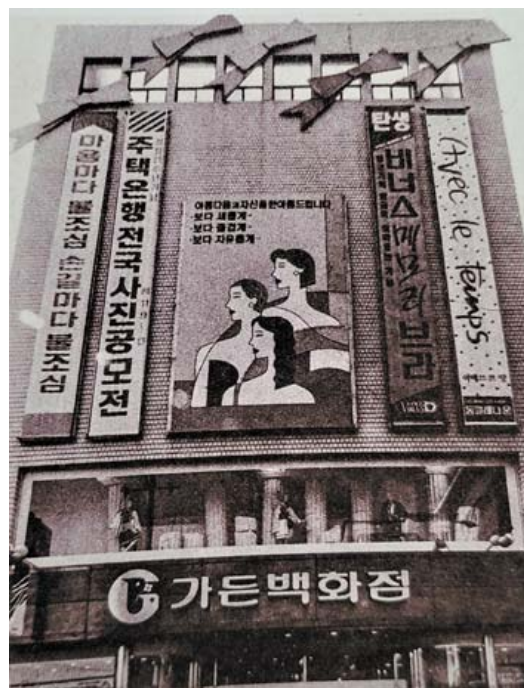
1988년 가든백화점(광주역사민속박물관 총장로도록2021).

지금 ZARA광주점 자리, 총장로3가 6·3번지구 광주은행 본점터에 1984년 7월7일 태산백화점(김상영)이 개소한다. 1990년대 초 호남백화점(최형기)일 때 매출액은 73억원, 1995년 신원그룹에 매각, 이듬해 프라이비트(김영준)로 바뀐다. 지하 1층·지상 5층, 매장면적은 1천200평 내외다.