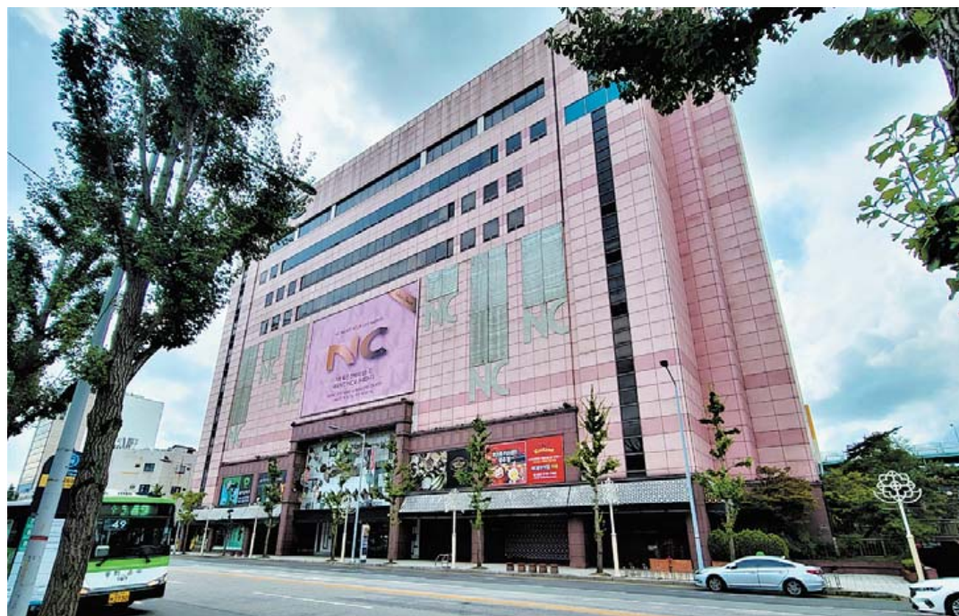
신안동 NC백화점 광주역점(향토지리연구소2022).