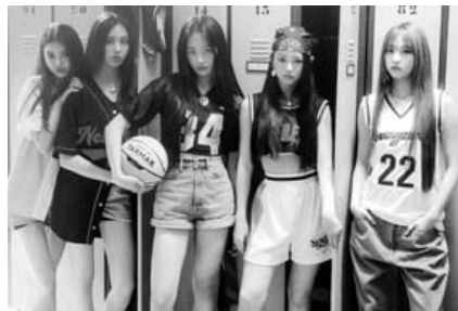
역대 걸그룹 초동 판매량 신기록을 경신한 뉴진스

그러면서 '아이브의 러브 다이브'나 나연의 '팝' 등 히트한 걸그룹 노래는 모두 틱톡에서도 흥했다는 공통점이 있다"고 덧붙였다. /연합뉴스