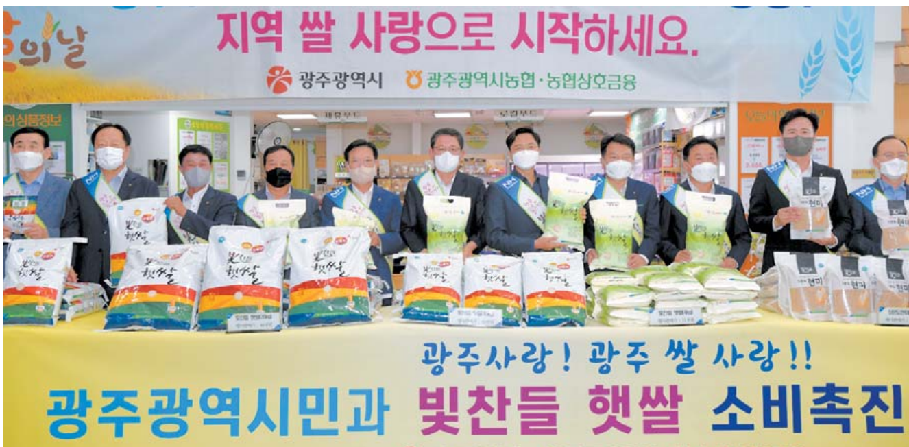
“광주쌀 많이 애용해주세요” 쌀 소비 감소와 공급 과정에 따른 쌀값 하락 등으로 어려운 상황에 직면해 있는 농가를 돕기 위해 16일 광주 시청 1층 로컬푸드직매장 앞에서 ‘광주쌀 소비확대 캠페인’이 전개됐다. 이날 캠페인에 참석한 김광진 광주 문화경제부시장과 고성신 농업광주지역본부장 등 관계자들이 업무협약을 체결한 뒤 쌀소비 촉진 퍼포먼스를 하고 있다.