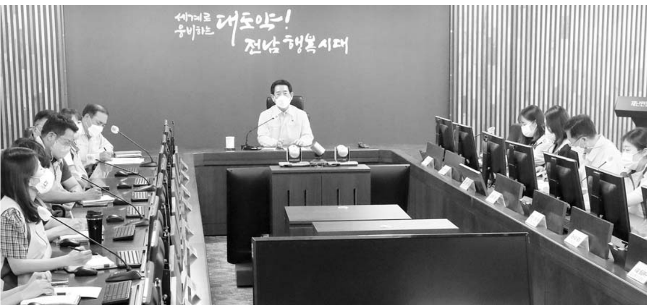
김영록 전남지사가 31일 도청 재난안전상황실에서 제5호 태풍 '송다' 대처상황 보고회를 갖고 있다. 이날 김 지사는 재산과 인명피해가 발생하지 않도록 피해 예방 활동을 당부했다.

이와 함께 도는 일정 기간 도내에 머무르며 농촌 문화를 체험하는 '농촌에서 살아보기 사업'을 추진하고 도시민 대상 교육·상담·정착을 한 번에 서비스하는 '귀농산어촌 종합지원 센터(서울 양재동)'를 운영하는 등 다양한 귀농인 지원책을 펼치고 있다. 이에 따라 매년 4만명 이상의 귀농·귀촌인이 전남에 유입되고 있다. /변은진기자