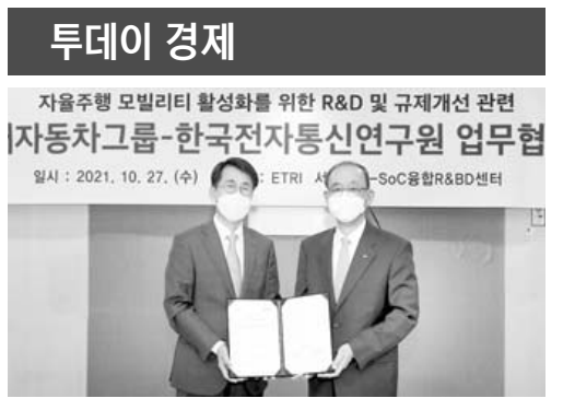
현대차·기아-ETRI, 모빌리티 활성화 협약

박람회, 미래 에너지 어린이 그림대회, 인공지능 로봇개 스폿(SPOT) 퍼레이드 등이 마련돼있다. 전시회 직접 참가가 어려운 경우에는 온라인 플랫폼에 구축된 메타버스 가상 공간에 입장해 전시 부스를 둘러보고 참가사와 소통할 수 있다. 온라인 부스 내에서 비즈니스 미팅과 수출 계약도 가능하다. 한전 관계자는 “BIXPO를 통해 산업계가 에너지 최신 기술을 공유하고 국내외 유수기업 간 교류·협업을 확대하는 기회의 장을 제공하겠다”고 말했다. /기수회기자