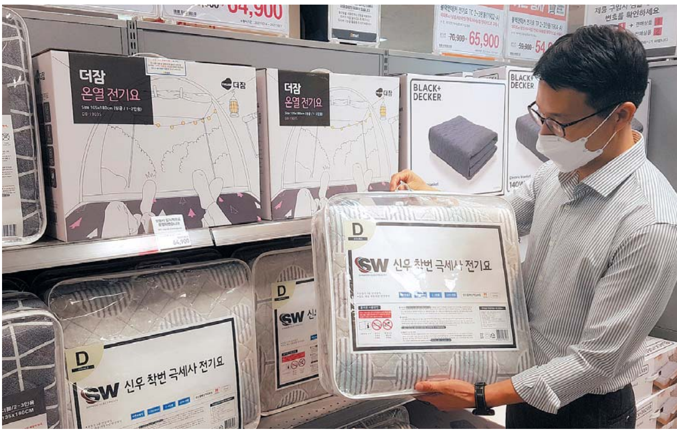
때 이른 추위에 난방용품과 겨울의류가 인기다. 27일 오후 이마트 광주점에서 한 고객이 전기요 등 난방용품을 고르고 있다.

면개편해 오픈했다. 또한 ESG팀과 ESG 추진위원회를 신설해 포용금융과 생산적 금융에도 주력하고 있으며 당기순이익의 10% 이상을 지역사회에 환원하기 위해 ‘희망이 꽃피는 공부방(현재 65호점까지 선정)’과 ‘희망이 꽃피는 꿈나무’(현재 6호점까지 선정), (재)광주은행장학회 장학금 지원(현재 4천여명에 총 33억원 상당 장학금 지원) 등 다양한 사회공헌활동도 지속적으로 전개하고 있다. /기수회기자