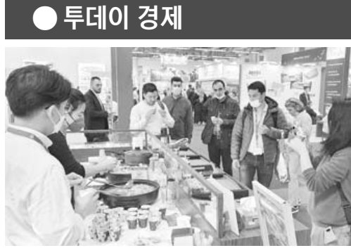
aT "독 식품박람회서 950만달러 수출 상향"

다는 입장이 확고하다. 따라서 DSR 규제를 이미 발표된 일정보다 조기에 도입하는 방안이 보완대책에 포함될 가능성이 크다. 제2금융권에 대한 대출 규제도 강화될 것으로 보인다. DSR 규제로 제2금융권에 대출이 물리는 종선효과를 막기 위해 1·2금융권에 일괄적으로 DSR 40%를 적용할 것이라는 전망이 나오고 있다. 하지만 전세대출에도 DSR을 적용할지는 아직 불분명하다. 전반적으로는 실수요 보호를 위해 전세대출의 경우 DSR을 적용하지 말자는 의견이 우세한 것으로 전해졌다. /연합뉴스