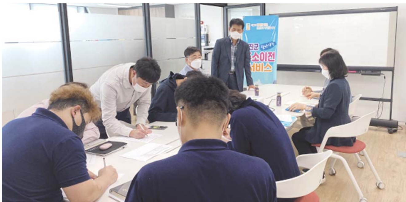
강진군이 전입 신고가 어려운 직장인들을 직접 찾아가는 '찾아가는 주소이전 서비스'를 추진, 호응을 얻고 있다.

강진군이 지역 인구 감소 문제를 해결하고 인구 수를 지키기 위해 '강진품애(愛)살기 운동'을 적극 전개하고 있다. 강진품애(愛) 살기 운동은 공직자부터 솔선수범해 강진 관내에 거주할 것을 독려하고 관내 거주 주민 중 관외에 주소를 둔 주민에게 주소 바로 두기를 권장하는 운동이다. 귀농·귀어·귀촌을 원하는 도시민을 유치하고 관내 기관·단체 임직원 중 먼 거리를 출·퇴근하는 직원에게 강진에서 살도록 권장하고 있다. 지난해부터 계속되는 코로나19로 강진품애 살기 운동 추진에 어려움이 있었지만 군은 포스터와 리플릿을 제작해 관내 각 기관에 배부·계시하고 LED 광고 송출로 인구 유입에 총력 대응했다. 이에 최근 관내 기업인 에스디피씨(주)는 '찾아가는 주소이전 서비스'를 이용해 관내에 거주하지만 관외에 주소를 둔 직원들을 전입하도록 독려해 현재까지 14명이 전입했다. 군은 강진품애 살기 운동에 협조하고 있는 기관단체·기업체에 전입지원금을