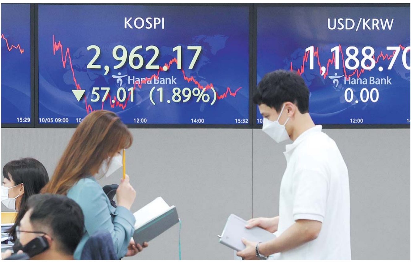
2,960대로 밀려난 코스피 5일 마감한 코스피가 인플레이션 불안과 중국 헝타 그룹 사태 등 악재가 겹치면서 2,960대로 밀려났다. 이날 코스피는 전장보다 57.01포인트(1.89%) 내린 2,962.17에 장을 마쳤고, 코스닥지수는 27.83포인트(2.83%) 급락한 955.37에 종료했다.

금융감독원이 '은행점포 폐쇄 시 사전 신고제 및 점포폐쇄 가이드라인을 만들어 시행하겠다'고 했지만 과연 실효성이 있는지 의문"이라고 지적했다. 유 의원은 이어 "금융당국은 고령층 전담 전포, 은행 창구업무 제휴, 디지털 금융 교육 등 고령자 소외를 막기 위한 정책을 마련해야 한다"며 "점포 폐쇄 전 사전 용역 절차 의무화나 공동점포 설치, 우체국 활용 등의 조치도 강구해야 한다"고 덧붙였다. /기수회기자