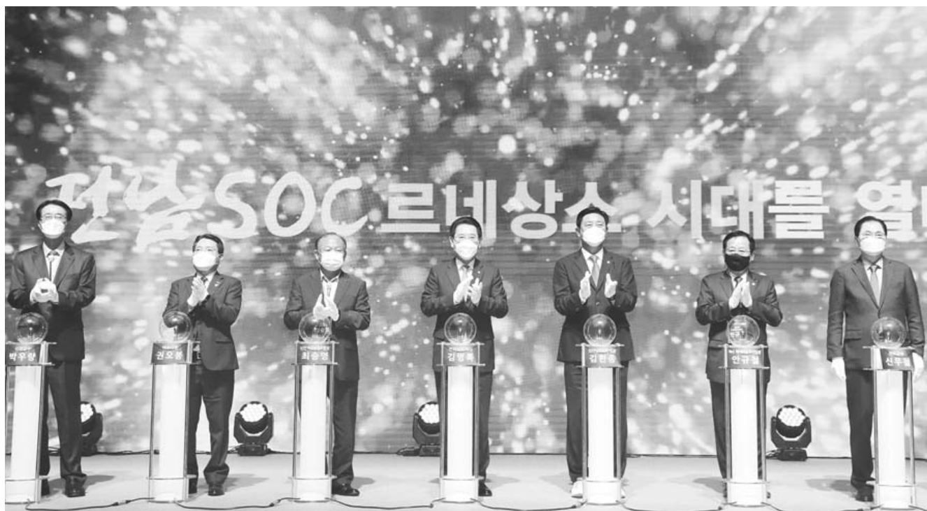
5일 오후 도청 왕인실에서 열린 '전남 SOC 국가계획 반영 보고대회'에서 김영록 전남지사가 참석자들이 피포먼스를 하고 있다.

이러한 결과가 초래된 것은 상당수의 기타 공공기관, 공적 유관단체 등이 지방이전 대상에서 제외됐기 때문이다. 조오섭 의원은 "출선수법해야 할 정부부처와 공공기관들이 지방이전 공공기관의 종전부동산을 재매입해 기존 용도로 재사용하는 '돌려막기' 품수를 부리고 있다"며 "공공기관의 완전한 지방이전과 종전부지의 공적 활용을 담보해야만 국가균형발전 정책이 실질적인 성과를 거둘 수 있다"고 지적했다. /김진수기자