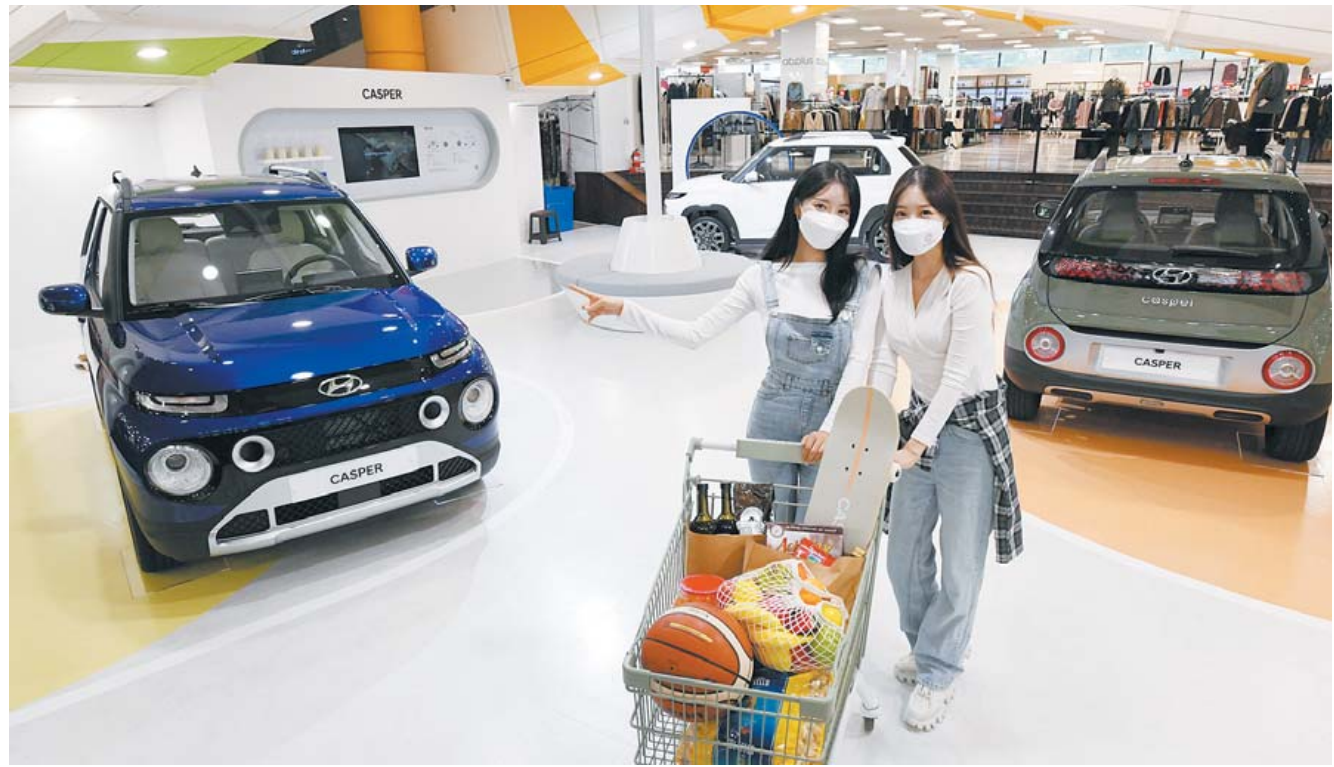
GGM 신차 '캐스퍼' 본격판매 현대자동차가 '캐스퍼' 온라인 발표회를 열고 본격적인 판매에 돌입한 가운데 홈페이지가 내년 3월까지 부채 상환과 간접점, 판매점, 전수화점 등에 '캐스퍼' 차량을 전시한다. 캐스퍼는 '광주형 일자리' 사업으로 탄생한 현대차의 첫 경형 스포츠유틸리티차(SUV)로 광주글로벌모터스(GGM)에서 위탁 생산한다.