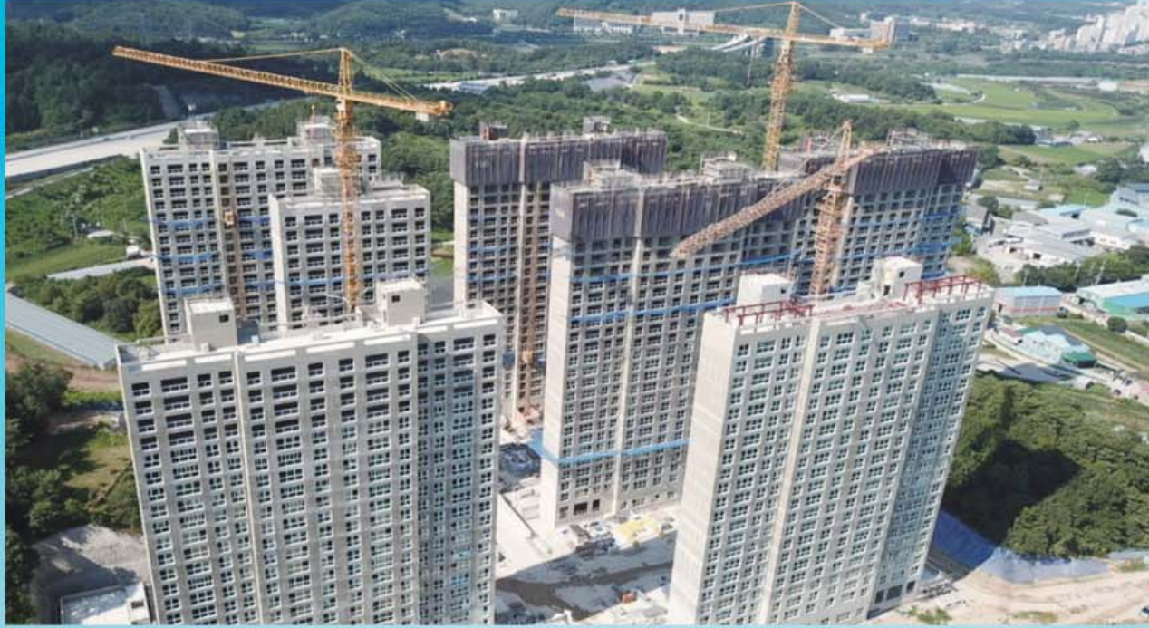
현장 드론 촬영 사진